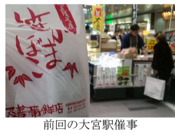
前回の大宮駅催事

◆埼玉県ルミネ川越 1月22日～27日 JR川越駅改札前特設 10時～20時 (最終日17時)