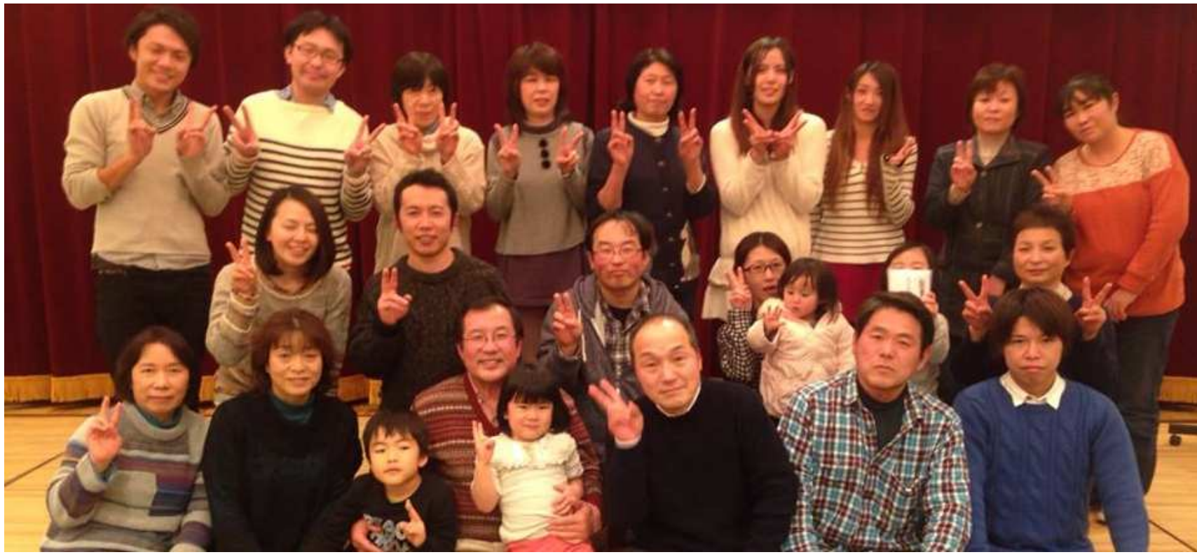
☆☆☆☆☆☆☆☆2015年1月 新年会にて全員集合写真☆☆☆☆☆☆☆☆