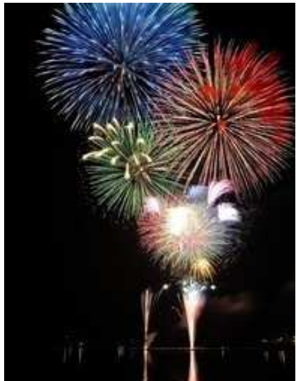
燃え上がる 数千発の 大花火