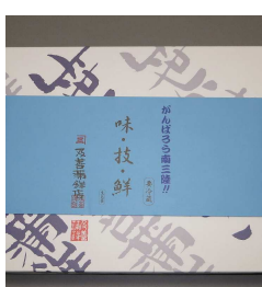
人気1位の潮風ヤマト