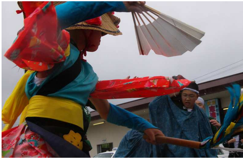
2013年 志津川湾夏まつり福興市 写真より