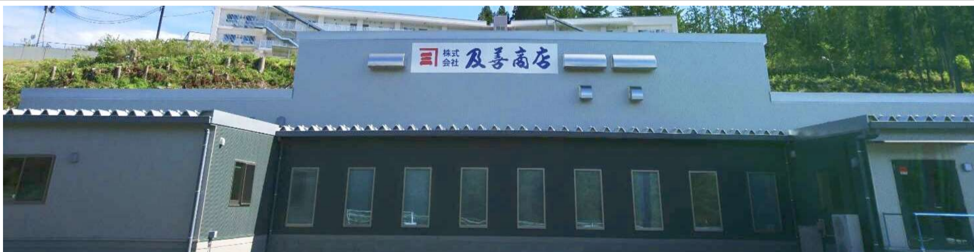
南三陸町に完成した及善商店新工場