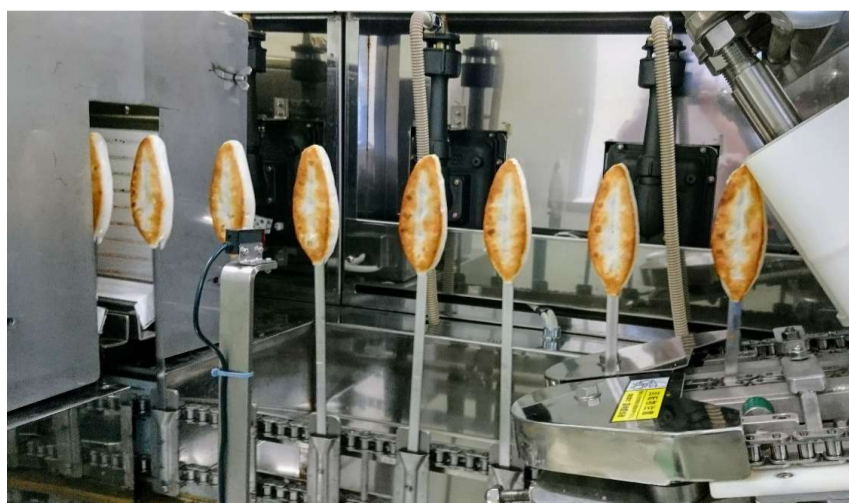
焼炉から出てきた出来立ての笹かまぼこ

新工場住所 〒986-0872 宮城県本吉郡南三陸町入谷字桜沢124-1 TEL:0226-46-2048 FAX:0226-46-2038